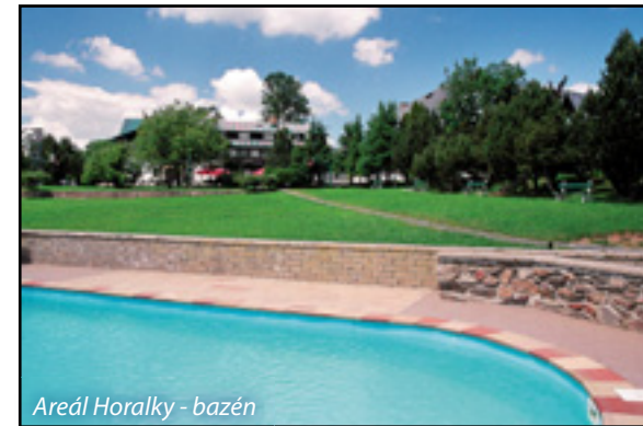
Areál Horalky - bazén

Petřikovice - Okrzesyn, Zdoňov - Laczna, Janovičky - Gluszyca Gorna, Česká Čermná - Brzozowie.