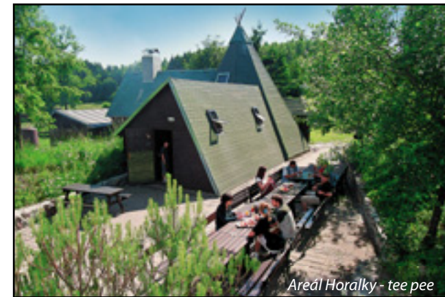
Areál Horalky - tee pee

- evropský unikát Krátký turistický výlet ( z Horalky 15 min.) směrujte na jedinečnou přírodní skalku pana Grulicha v Sedloňově. Zajímavá přírodní scenerie Vás okouzlí v každém ročním období.