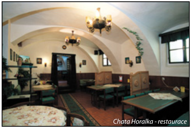
Chata Horalka - restaurace