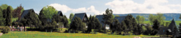
Areál Horalky - bungalovy